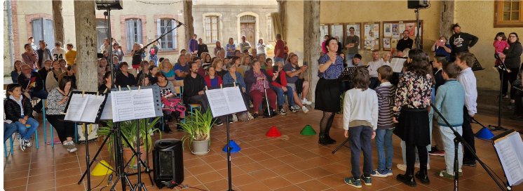
L'art sous toutes ses formes avec le Printemps des Arts 2025

Une fête artistique et conviviale au cœur samedi 24 mai.