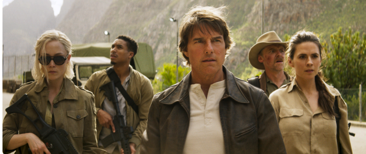
"Mission : impossible" en avant-première !

Attention, cette semaine passage à l'heure d'été pour les séances du soir de Cinequanon : 21 h et non 20 h 30 !