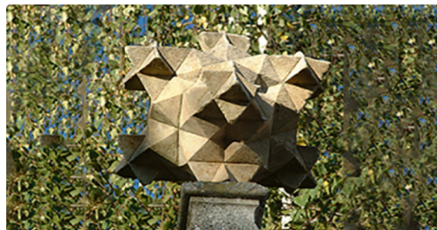
mirande octaedres 13.jpg