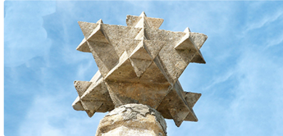
Tout savoir sur les octaèdres dans le Gers