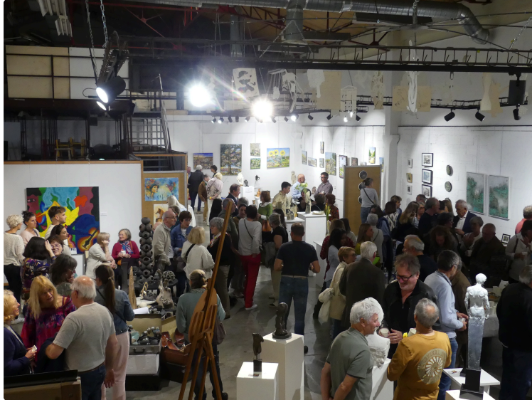
Vernissage Atelier des berges du Gers: 9 mai 2025 des œuvres de 9 artistes européens