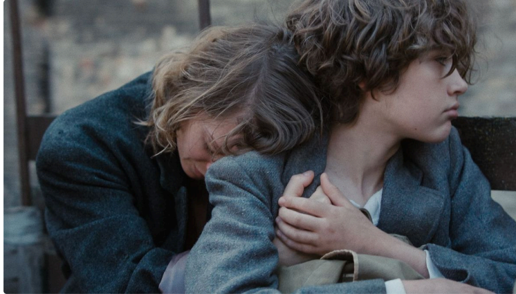
Cinequanon : drame et comédie au programme cette semaine !

Drame et comédie au programme de la semaine !