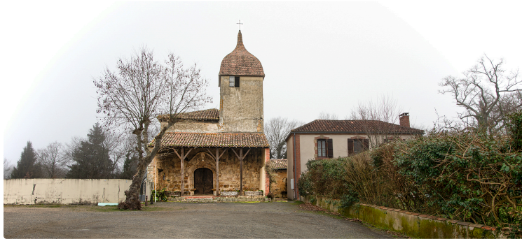
Concert original et varié en l'église de Lanne-Soubiran

L'association Les Amis de l'église de Lanne-Soubiran organise un concert dimanche 11 mai 2025, qui sera donné à 17 heures à l'église de Lanne-Soubiran.