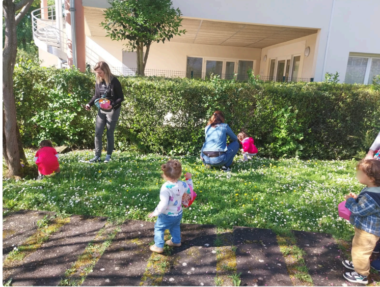
Chasse aux œufs intergénérationnelle à l'EHPAD de l'hôpital : un moment de partage et de joie

Mardi 29 avril, le soleil était au rendez-vous dans le jardin de l'EHPAD de l'hôpital de Vic-Fezensac qui a résonné des rires des tout-petits et des sourires des aînés, réunis pour une chasse aux œufs intergénérationnelle pleine de tendresse.