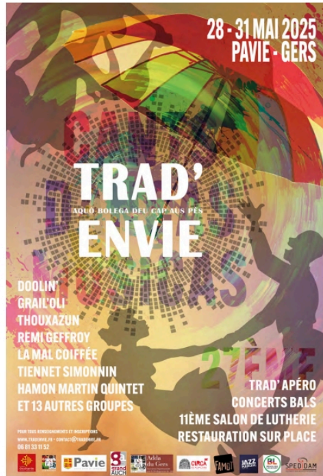
Festival TRAD'ENVIE 2025 : 34 ans de musiques du monde et de convivialité à Pavie et Auch

Trad'envie qu'ei regde mei qu'un hestenu !