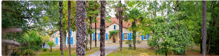
Programme mai 2025 de la Médiathèque du Houga

Voici le programme établi par la Médiathèque du Houga pour le mois de mai 2025 :