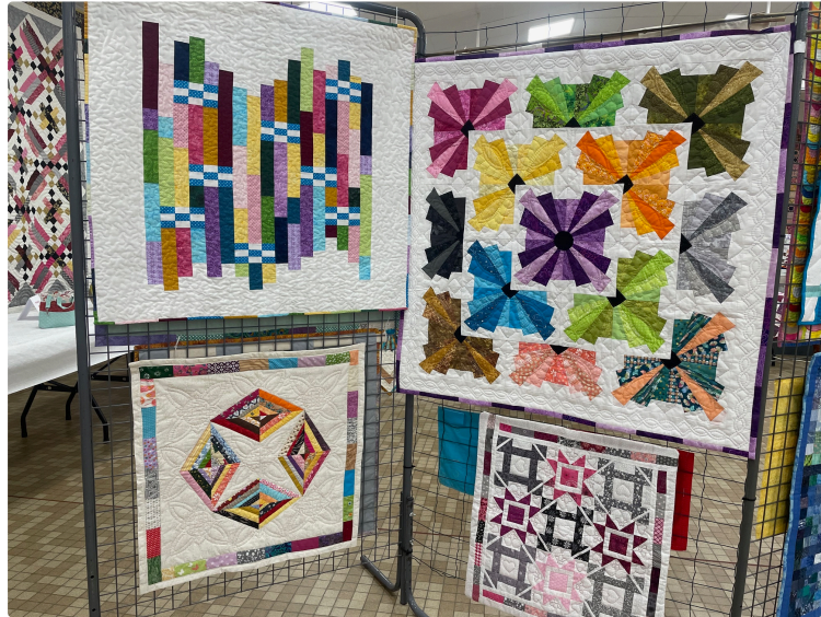
Le patchwork à l'honneur lors d'une exposition haute en couleurs.

Les 17 et 18 mai prochains, de 10h à 18h, l'association "Le Fil et le Patch" ouvre les portes de sa deuxième exposition dans la salle des fêtes de Monferran-Savès. L'occasion de découvrir près d'une centaine de créations textiles uniques, fruits du travail minutieux et passionné de quilleuses locales.