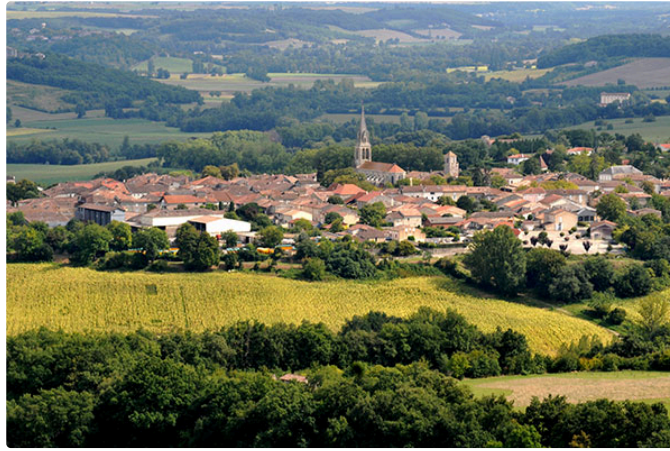
L'association " Les Chats libres de Saint-Clar" sera présente ce dimanche au vide-grenier du village .....

L'association "Les Chats libres de Saint-Clar" sera présente sur le vide greniers de Saint -Clar le 4 mai. Elle espère vous voir nombreux à venir découvrir son stand et à la soutenir dans les actions qu'elle mène.