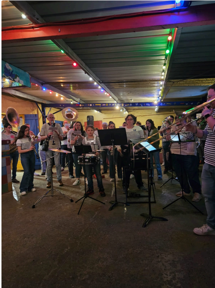
L'harmonie vicoise ouvre la période festive !

Pour lancer le temps des festivités estivales, l'Harmonie vicoise organise une soirée musicale