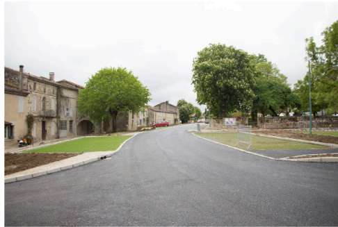
On roule mieux à La Romieu...

Depuis jeudi matin, on peut de nouveau traverser le village par la D41. Commencée mi-novembre 2024, la première phase des travaux est achevée, même si des aménagements paysagers et des plantations restent à effectuer. Pour ne pas gêner la période estivale et touristique la seconde phase reprendra à l'automne.