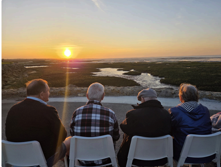
Séjour ensoleillé à Gujan-Mestras pour des résidents de l' EHPAD de l'hôpital