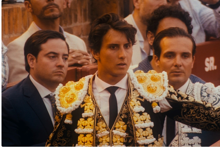
Cinequanon : deux soirées spéciales

Les enfants sont encore à l'honneur en cette fin de vacances.