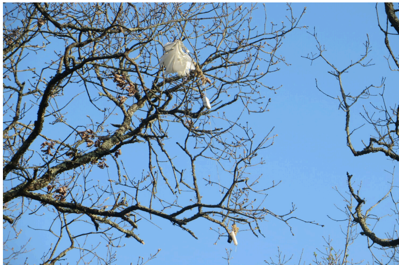
Radiosonde perchée au sommet d'un grand chêne, à une dizaine de mètres, sur la commune de Bazian (Gers)