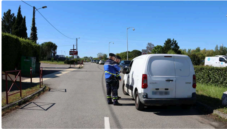
Sécurité routière : vigilance sur les routes gersoises durant le week-end de Pâques

Après un week-end meurtrier sur les routes du Gers, le préfet exhorte tous les usagers de la route à une vigilance accrue.