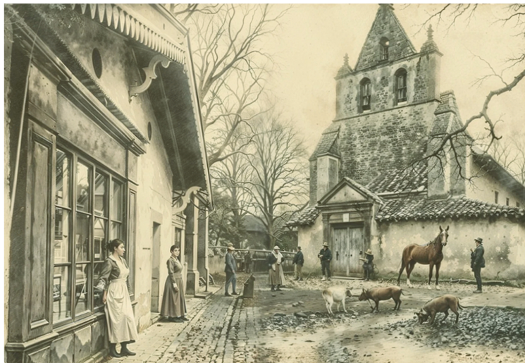
Redonner voix à Louise Espinasse-Mongenet : une campagne de souscription pour une réédition inédite.

1900 REGARD D'UNE FEMME SUR UN VILLAGE DU SAVÈS