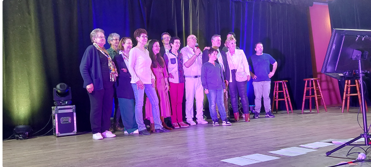
Un concert solidaire très réussi au profit de la Ligue contre le cancer

C'est dans une salle polyvalente joliment décorée pour l'occasion que s'est déroulé, ce dimanche après-midi, un concert solidaire d'une grande chaleur humaine, organisé au profit de la Ligue contre le cancer.