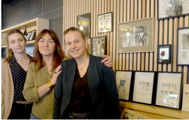
Une expo pas comme les autres : Virginie Dancoing s'installe au PicPac jusqu'au 19 avril

Depuis le vendredi 4 avril, l'artiste Virginie Dancoing expose son univers aussi poétique que déjanté dans les murs du PicPac , à Auch. Une trentaine de visiteurs ont répondu présent pour le vernissage, curieux de découvrir ses œuvres.