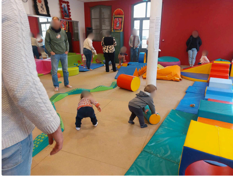
Belle réussite de la matinée Petite Enfance 2e édition !

Pour la deuxième année consécutive, la Communauté de communes d'Artagnan en Fezensac organisait, samedi 22 mars, sa Matinée de la Petite-Enfance !