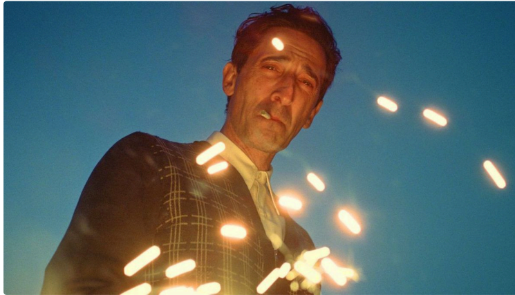
Au cinéma cette semaine, séance de rattrapage pour le film phénomène "The brutalist"

Mais aussi drame, aventure, animation au programme !