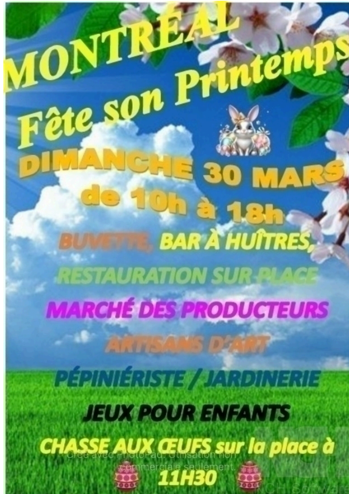
Montréal-du-Gers accueille les arts et le printemps

Le Printemps est bien arrivé dans la Bastide de Montréal-du-Gers