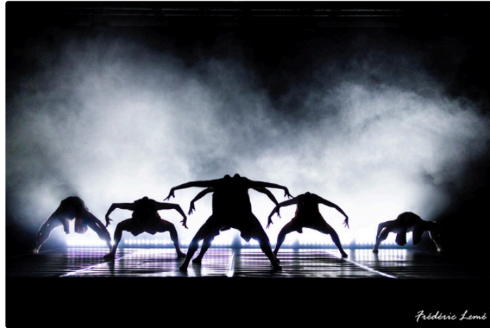
Une compagnie contemporaine en mouvement

Le vendredi 4 avril, la Compagnie B & M, propose au théâtre des Carmes à 20 h 30 deux magnifiques ballets pour marquer les 5 ans de la compagnie.