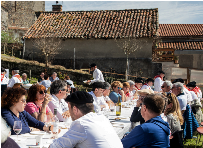
Repas aux tisons