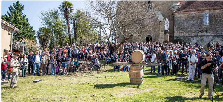
Programme de Saint-Mont Vignoble en fête 2025

Du vendredi 28 au dimanche 30 mars 2025, les vignerons de Plaimont Producteurs se font une joie de présenter leur travail, leurs vignes et leurs vins.