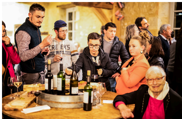
Foule en soirée du vendredi à Lupiac