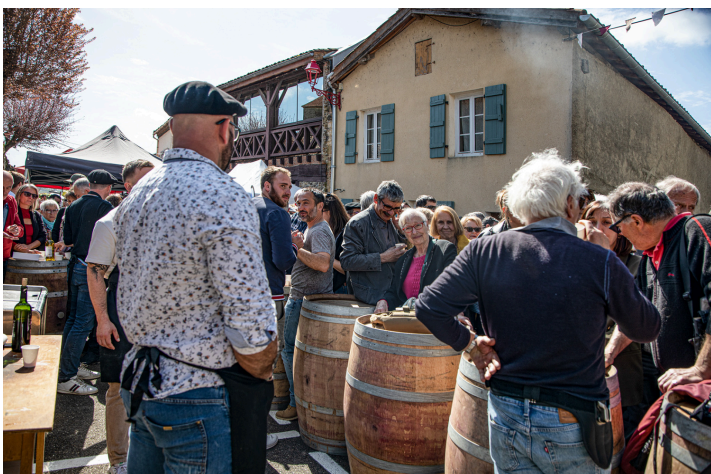
Les bars en ville à Saint-Mont pris d'assaut

15 heures : dégustation commentée de 6 cuvées d'exception – COMPLET.