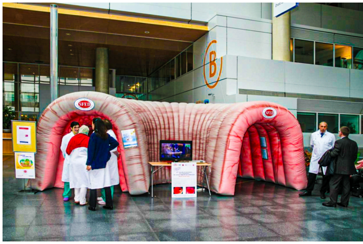
Structure gonflable

Le Côlon Tour donne la liste ci-dessous de produits à éviter.