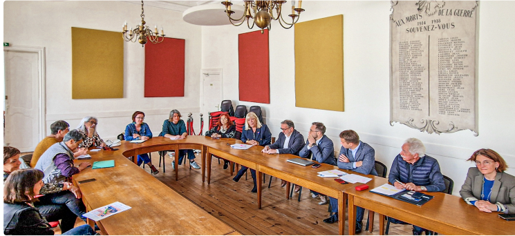
34,1 % des 60 980 Gersois et Gersois invités au dépistage du cancer du côlon l'ont fait en 2022-2023 ; 718 tests se sont révélés positifs sur ces 34 %.

Le Côlon Tour est passé par Nogaro vendredi 21 mars 2025. Son but : sensibiliser au dépistage du cancer du côlon les hommes et les femmes de 50 à 75 ans. Ce dépistage est entièrement gratuit.