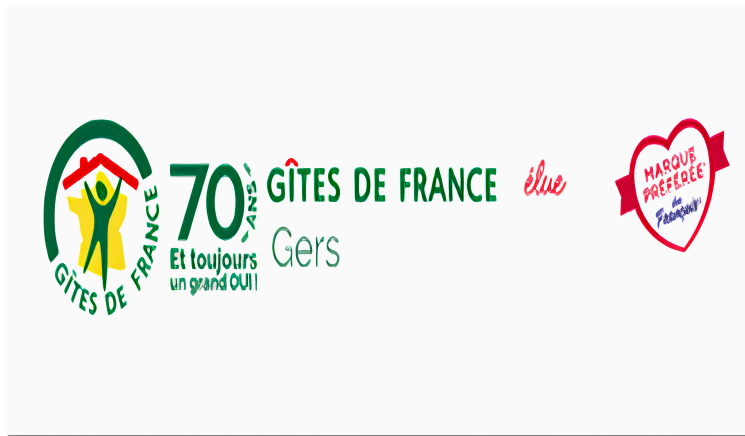
Assemblée générale des Gites ruraux du Gers