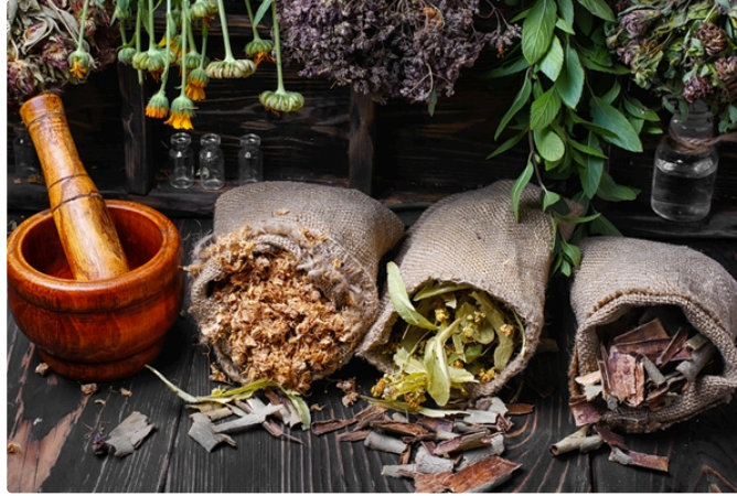
Herboristerie: reconnue ou dénoncée? ...

Les plantes médicinales seront à l'Honneur à la Foire au Jardinage de Pavie le 30 mars..