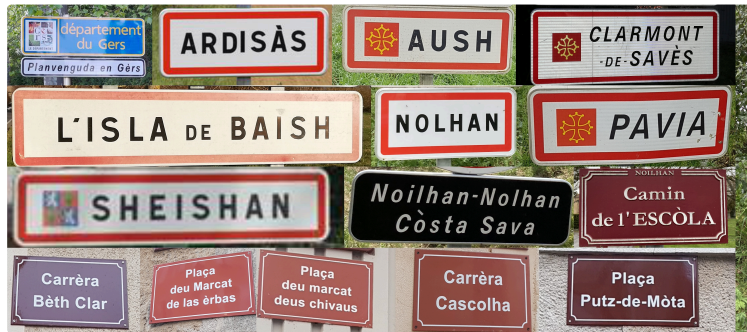
L'occitan qu'es aquò ? L'escritura de la lenga