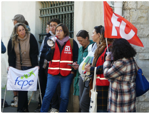
Un discours de motivation de la part du syndicat du FO.JPG