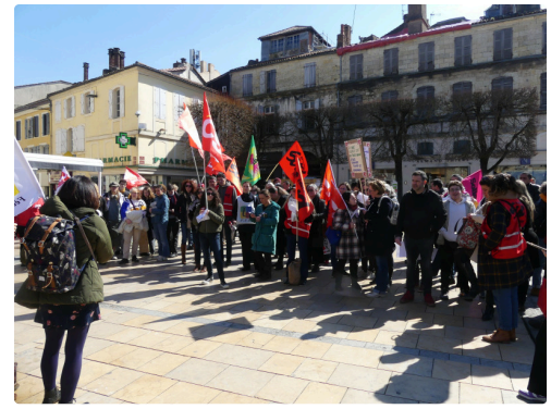
Leur arrivée Place de la Libération.JPG