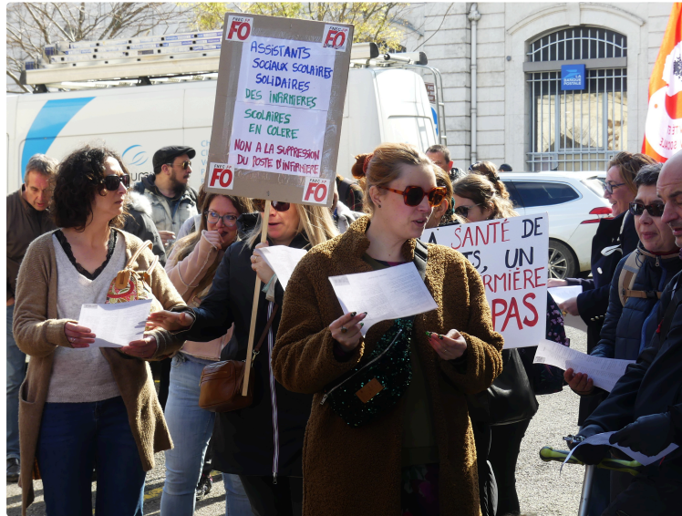
Une manifestation contre les fermetures de classes

A Auch, ce lundi 17 mars, une cinquantaine d'enseignants se sont réunis place de la Libération pour lutter contre la fermeture de classes et les suppressions de postes.