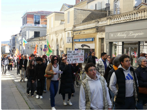
Un soutien de taille.JPG