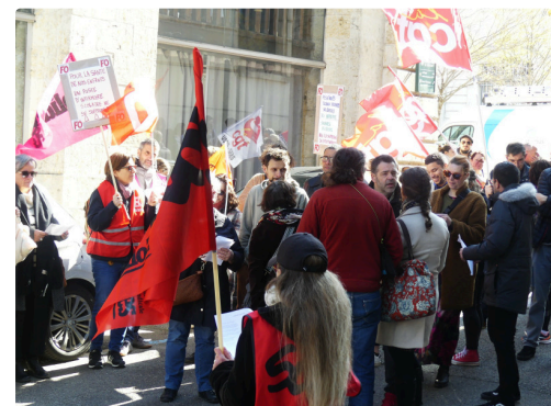
Beaucoup de personnes étaient présentes à cet événement.JPG