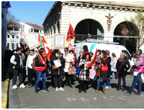
Le départ est proche.JPG