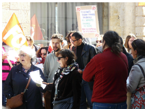
Les manifestants scandant leur slogans.JPG