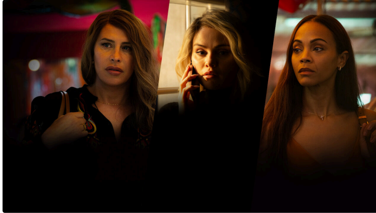
Cinequanon : séances de rattrapage après les César et les Oscar avec "A real pain" et "Emilia Perez"!

N'attendez plus! Devenez adhérent ou renouvelez votre adhésion pour l'année 2025!