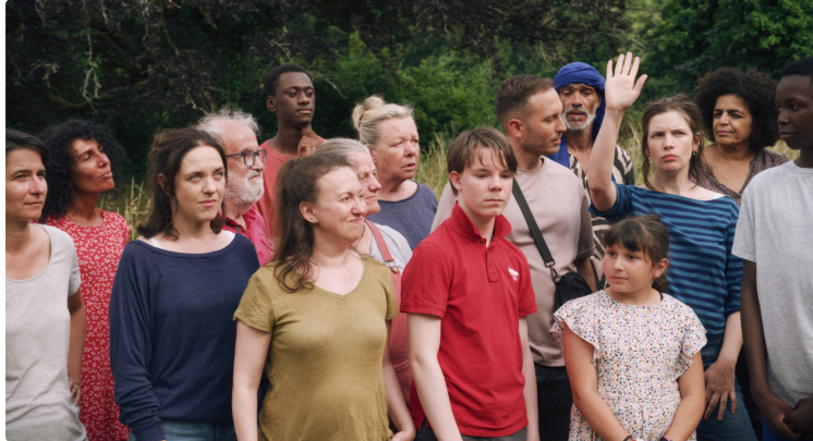
Première séance de la tournée du film "Bonjour l'asile" avec l'actrice Claire Dumas

Depuis près de 30 ans, le festival Indépendance(s) et Création de Ciné32 met en lumière des films art et essai de toutes nationalités et de tous horizons.