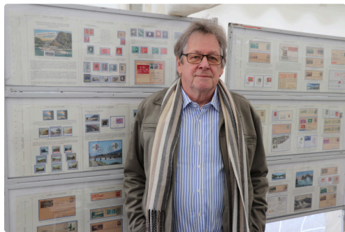
Auch 08032025 (5).JPG

Pour se procurer les souvenirs philatéliques, contacter l'association gersoise Philajeune, philajeune@laposte.net Enveloppes, et cartes oblitérées du timbre à date « Auch 8 mars 2025 ».