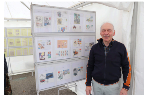
Auch 08032025 (9).JPG