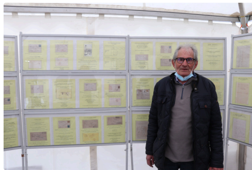
Auch 08032025 (2).JPG