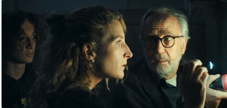
Cinequanon : aventure et vélo cette semaine !

N'attendez plus! Devenez adhérent ou renouvelez votre adhésion pour l'année 2025!