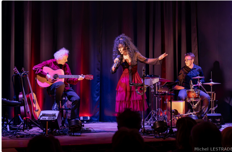
Plus de 10 000 personnes s'étaient données rendez vous dans ce petit village !

La sortie du nouvel "Toi que le hasard " a fait un tabac.