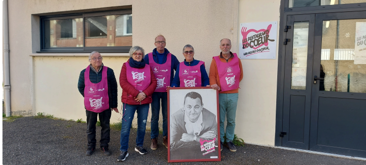
Les Restos du Coeur comptent sur vous !

Les Restos Du Coeur organisent leur collecte nationale les 7, 8 et 9 mars prochains.