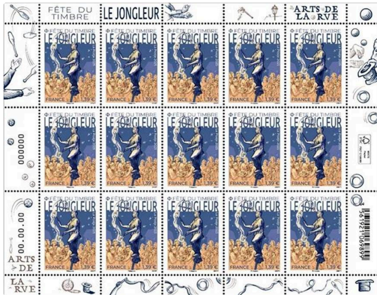
Fête du timbre 2025, entre Philajeune et la Poste, le timbre fait des acrobaties

La fête du timbre 2025 organisée par la fédération française de philatélie et la Poste se déroule dans 83 villes de France dont Auch, les 8 et 9 mars 2025, avec une nouvelle thématique sur les arts de la rue.