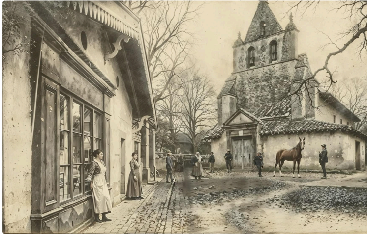
Laymont Patrimoine & Transmission

Participez à la préservation de notre histoire locale !