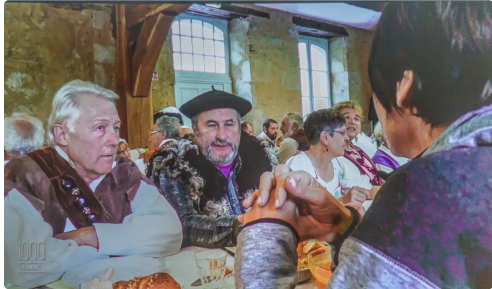
Les deux compères proposent à l'animatrice de faire chabrot - Photo prise sur l'écran