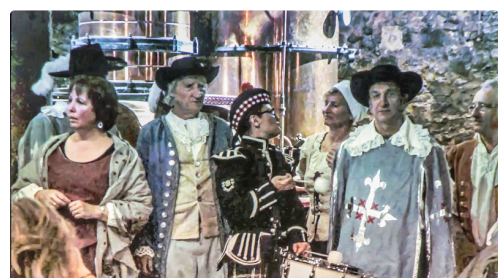
Au domaine de Tariquet - Photo prise sur l'écran

(2) On peut le voir chaque année en août au Festival d'Artagnan de Lupiac. (3) On sait que la famille Grassa est ce mécène gascon qui a financé la statue équestre en bronze de d'Artagnan, œuvre de Daphné du Barry, mise en place en 2015 sur la place du village.