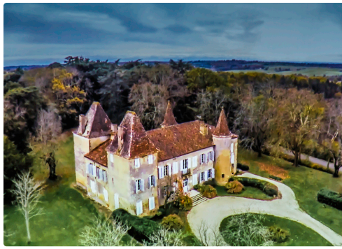
Le château de Castelmore (où est né d'Artagnan) - Photo prise sur l'écran