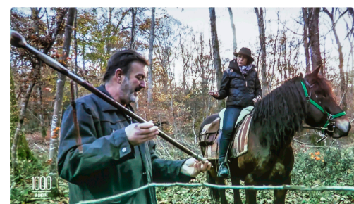
Avec le faiseur de bâtons gascons - Photo prise sur l'écran