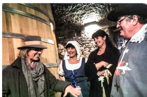
Au domaine de Tariquet - Photo prise sur l'écran