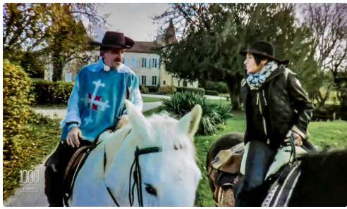
L'animatrice avec son guide - Photo prise sur l'écran