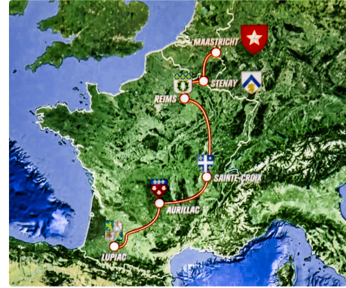
La route européenne d'Artagnan - Photo prise sur l'écran