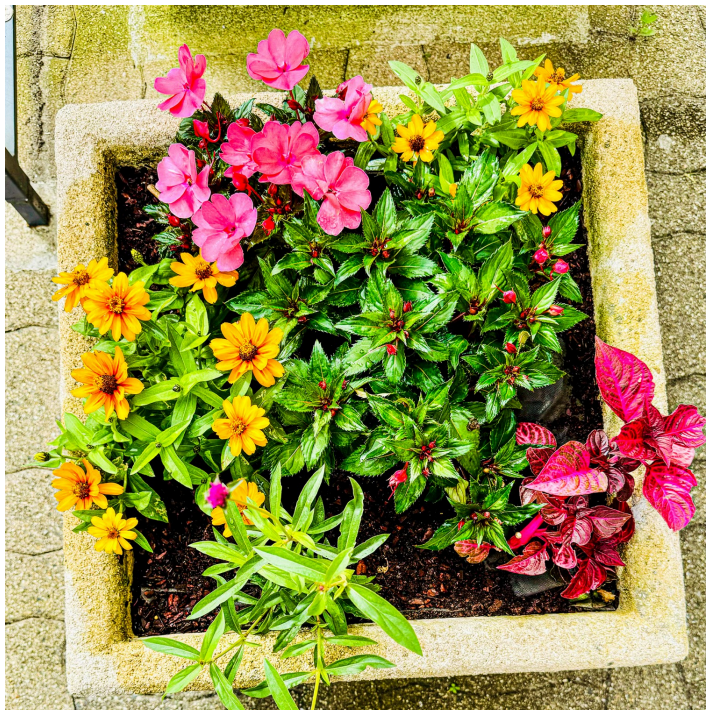
Création de la ville de Nogaro