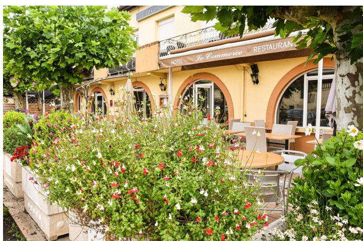
À l'hôtel Le Commerce