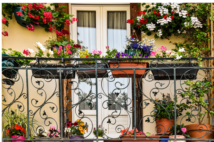
Chez Colette Jambes