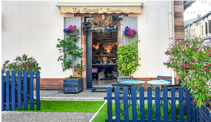
Chez Kareen (la Boutik)