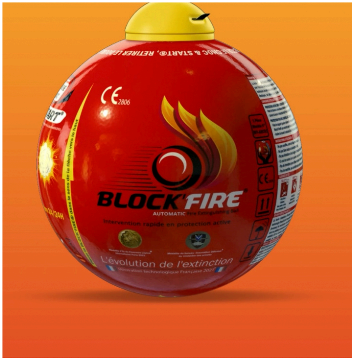
Gros plan sur la boule de Block'Fire International