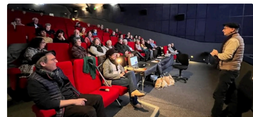
abadie livre presentation.JPG