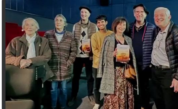
"Garder son âme"