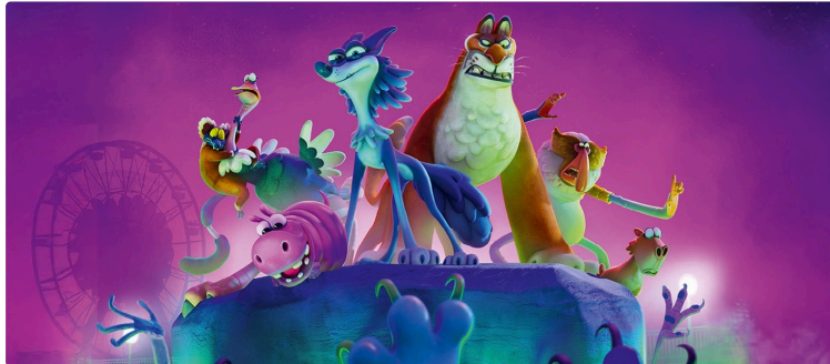
Cinequanon : le programme des vacances !