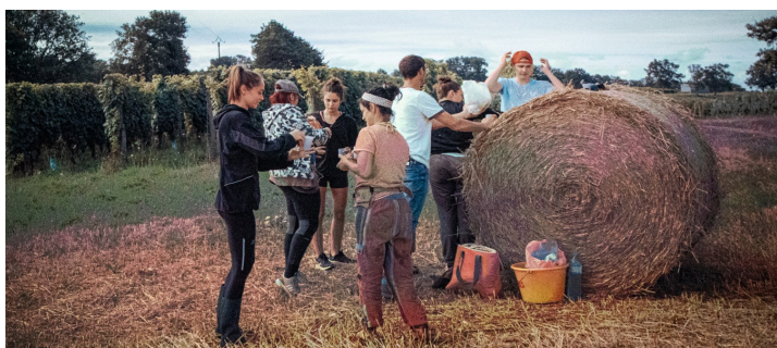
Casse-croûte aux champs