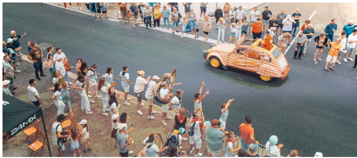
Pendant le passage du Tour de France à Nogaro