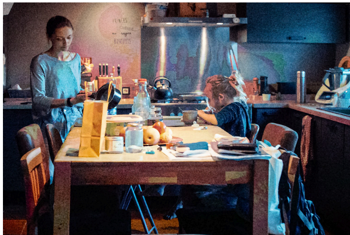
L'héroïne chez elle avec sa petite sœur

On voit une jeune fille, joueuse de flûte dans la banda la Chicuelina (de Nogaro) se poser la question : reviendra-t-elle voir les tournesols en fleur ?