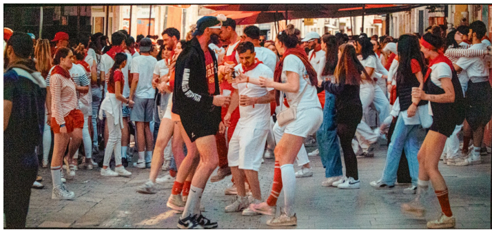
C'est la fête !