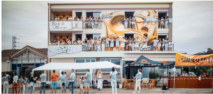
Les musiciens de Nogaro sur les balcons de l'Ecole de musique pendant le passage du Tour de France