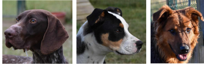
Les trois jeunes chiens de la semaine : Juju, Ava et Tsuko !

Cette semaine, la SPA vous présente trois jeunes chiens arrivés récemment au refuge, Juju, Ava et Tsuko.