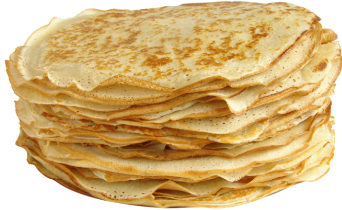
Fête des crêpes , une tradition qui perdure...

record à battre 540 douzaines de crêpes!