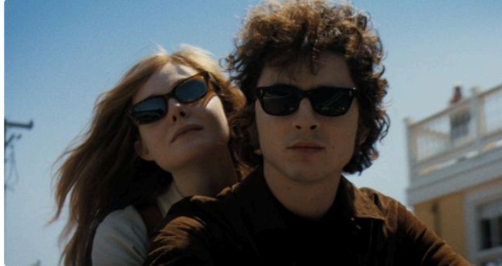
Au cinéma cette semaine, drame, comédie, aventure et le biopic de Bob Dylan

N'attendez plus! Devenez adhérent ou renouvelez votre adhésion pour l'année 2025!