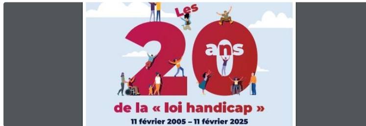
MDPH 32 : des manifestations pour valoriser les 20 ans de la loi handicap

Exposition photographique, tables rondes et ciné débat sont au programme