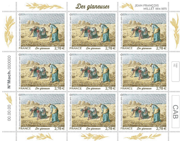
Des glaneuses, Jean-François Millet

Le 20 janvier 2025, La Poste a émis un timbre de la série artistique illustré par Des glaneuses de Jean-François Millet, à l'occasion du 150e anniversaire de sa disparition.