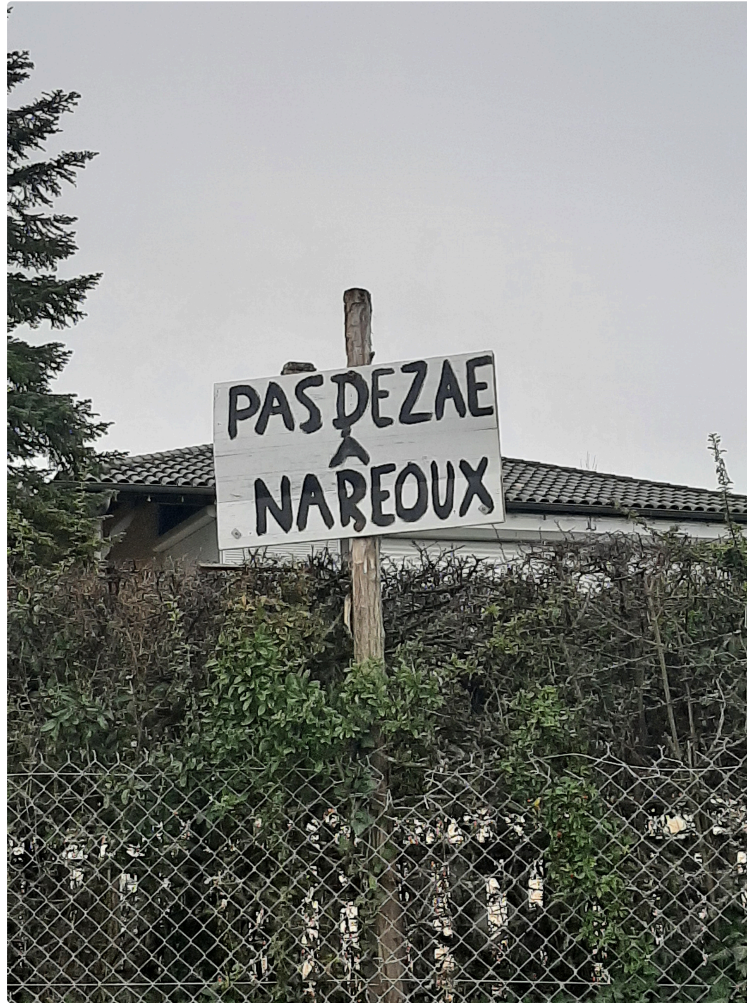
Le collectif des riverains de la ZAE de Naréoux-Auch demande des comptes aux élus.

Le 22 septembre 2024, l'agglomération du Grand Auch a lancé un appel d'offres pour trouver un concessionnaire capable d'aménager la ZAE de Naréoux (27 ha) et se débarrasser de ce dossier encombrant. La date limite des réponses a été fixée au 31 octobre 2024. A ce jour, soit 2 mois et demi plus tard, toujours aucune nouvelle des résultats de ce marché public (à supposer que l'agglomération souhaite communiquer).